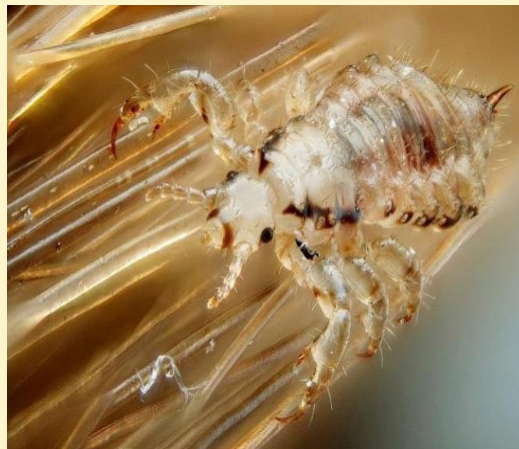
Фото головной вши

Наибольшее число укусов и раздражений кожи наблюдается в области затылка, висков и за ушами.